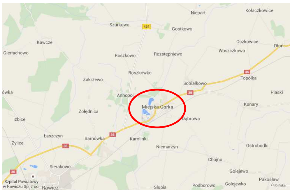
Rys. 1. Położenie Miejskiej Górki

Miasto Miejska Górka oddalone jest około 110 km od stolicy województwa wielkopolskiego – Poznania i 9 km od miasta powiatowego - Rawicza.